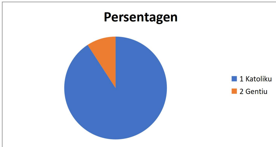
Gráfiku 2: Fiar Populasaun nian

Aleinde ne'e, populasaun suco Baboe-craic ne'ebé iha nesesidade espesífiku ka populasaun ho kondisaun defisiensia hamutuk 37ne'ebé kompostu husi feto 23, mane 50 Iha moos grupu vulneravel sira hanesan faluk, oan kiak, idozu no individu ne'ebé laiha rendimentu mak hanesan tuir mai ne'e: